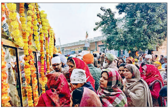
नरवाना। गुरु ग्रंथ साहिब के दर्शन करते साध संगत।