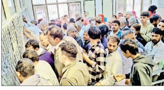
जींद। दवा खिड़की पर परेशान लोग।