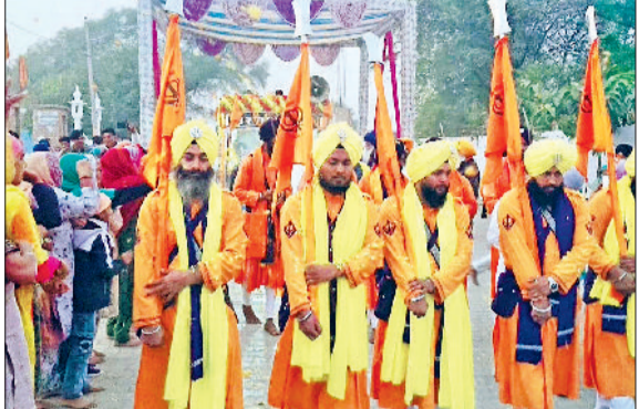
नरवाना। यात्रा की अगुवाई करते पंज प्यारें।