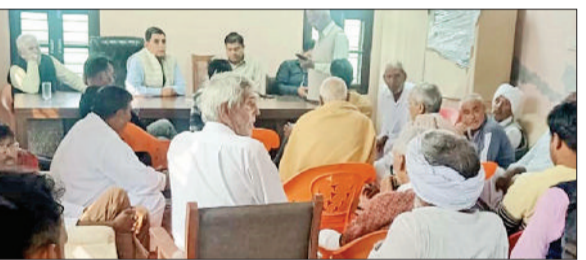
पूंडरी। गांव मुनोहड़ी में बिजली निगम द्वारा आयोजित आपन दरबार का दृश्य।