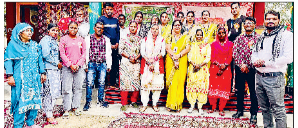
कैथल। कार्यक्रम में भाग लेते हुए विद्यार्थी।