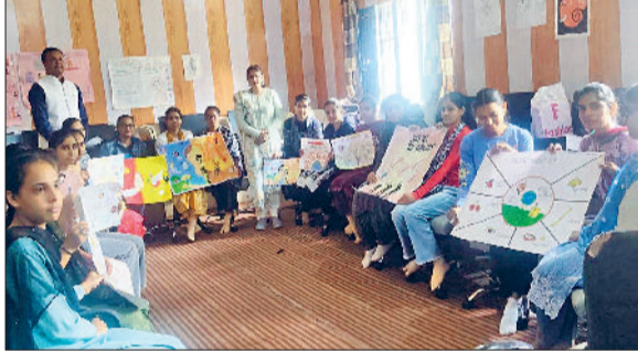
कैथल। एंटी ड्रग से संबंधित पोस्टर दिखाती छात्राएं।