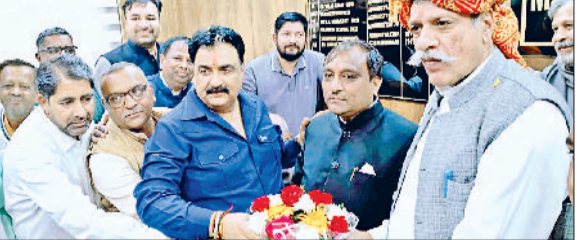
जींद। कार्यक्रम में डिप्टी स्पीकर डा. कृष्ण मिड्डा का स्वागत करते हुए।

हरियाणा विधानसभा के डिप्टी स्पीकर डा. कृष्ण मिड्डा ने कहा कि केंद्र एवं प्रदेश सरकार हर वर्ग का ध्यान रखते हुए कल्याणकारी कार्य कर रही है। किसानों के प्रति मौजूदा राज्य सरकार द्वारा निरंतर ठोस कदम उठाए जा रहे हैं। हाल ही में प्रधानमंत्री नरेन्द्र मोदी ने जिला के एक लाख 31 हजार 629 किसानों के खाते में करीब 26 करोड़ 33 लाख रुपये की धनराशि प्रधानमंत्री किसान सम्मान निधि योजना के तहत सीधा किसानों के खाते में डालने का काम किया है। हरियाणा में ट्रिपल इंजन की सरकार चेयरमैन व मुख्यमंत्री नायब सैनी के मार्गदर्शन में जन कल्याण को भावना से कार्य कर रही है।