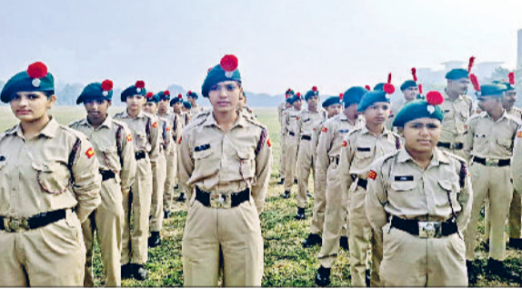
जींद। कार्यक्रम में भाग लेते एनसीसी कैडेट्स।